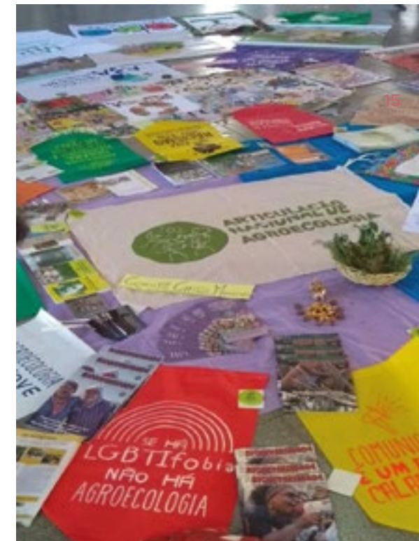
Material de GRAIN junto a muchos otros en la Articulación Nacional de Agroecología (ANA) en Curitiba, Brasil

En marzo, integrantes de GRAIN contribuyeron a la Asamblea Anual de la Red en Defensa del Maíz en México, con más de 500 personas de al menos 16 estados del país. Este encuentro entre personas y comunidades que defienden la vida de los “pueblos que defienden la vida con el maíz” fue un real éxito. En septiembre y octubre, participamos en la preparación de una declaración colectiva contra las nuevas leyes promulgadas para, supuestamente, proteger al maíz en México. En noviembre, trabajamos con grupos para publicar otra declaración, contra la propuesta de reforma