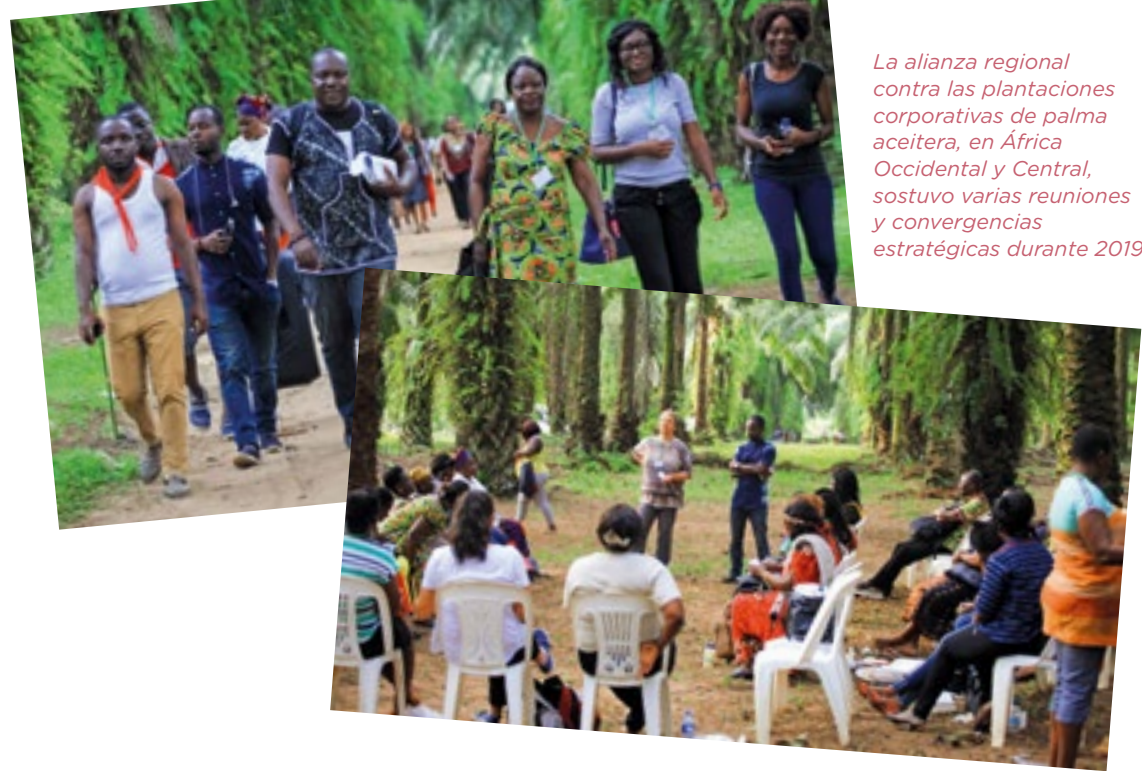
La alianza regional contra las plantaciones corporativas de palma aceitera, en África Occidental y Central, sostuvo varias reuniones y convergencias estratégicas durante 2019

La alianza regional contra las plantaciones corporativas de palma aceitera en África Occidental y Central está conformada por varias pequeñas organizaciones de base, que defienden el control de su comunidad sobre su territorio frente a las compañías que están tratando de obtener las tierras para palma aceitera y otras plantaciones industriales. La alianza trabaja facilitando la conexión entre los líderes de base, especialmente líderes mujeres, permitiéndoles compartir experiencias, idear estrategias y acciones colectivas, desarrollar herramientas y unir sus voces y luchas dentro de la región y a nivel internacional. La alianza se ha formado durante los últimos seis años con el respaldo coordinado de GRAIN y Movimiento Mundial por los Bosques tropicales (WRM por sus siglas en inglés) y ahora se ha consolidado como una herramienta, liderada localmente, para las comunidades y grupos en toda la región, para su lucha contra las plantaciones de palma aceitera.