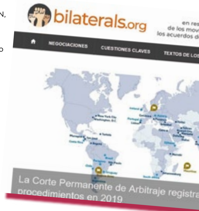
La nueva versión del sitio de internet de bilaterals.org proporciona un espacio dedicado a acuerdos comerciales específicos de la región, como la RCEP, un sistema de navegación simplificado, un nuevo diseño, un motor de búsqueda reforzado y expandido y material en múltiples idiomas

El alcance del proyecto continúa en crecimiento: el equipo a menudo responde a pedidos ad-hoc de parte de grupos a nivel global, como crear nuevas páginas para publicar las filtraciones de borradores de textos de negociación u otros documentos que no se han hecho públicos aún.