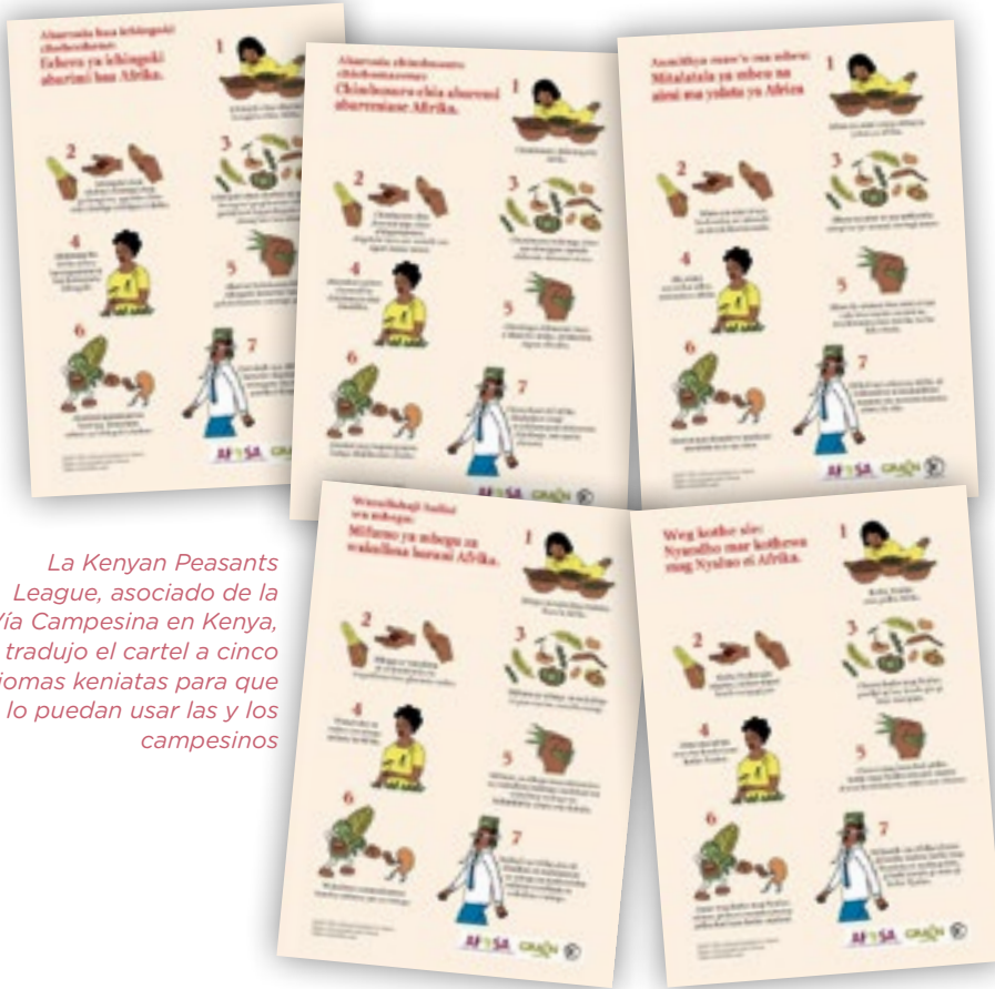
La Kenyan Peasants League, asociado de la Vía Campesina en Kenia, tradujo el cartel a cinco idiomas keniatas para que lo puedan usar las y los campesinos