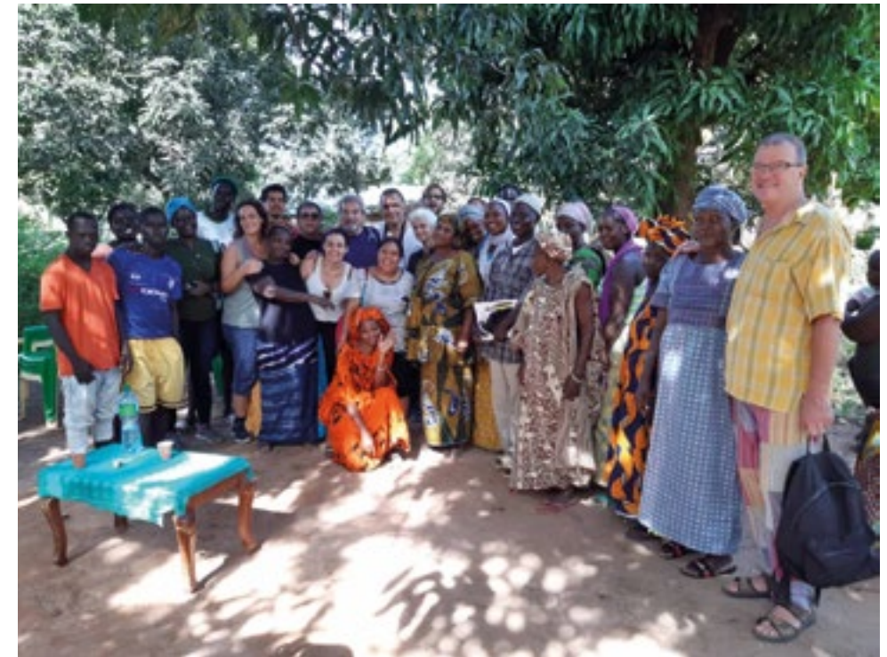
El encuentro anual de GRAIN con sus contrapartes en África, tuvo lugar en Senegal en octubre de 2019 y su punto central fue el tema del clima y el comercio. Con cerca de 20 participantes de 10 países distintos de África, además de miembros del equipo y el consejo de GRAIN, el encuentro proporcionó un espacio para analizar las conexiones entre comercio, alimentos y el cambio climático. Salimos del encuentro con un nuevo pensamiento estratégico e ideas acerca de cómo podemos desarrollar la cooperación entre grupos de justicia climática centrados en la energía y grupos de soberanía alimentaria centrados en la agroecología y semillas campesinas en África. Aquí, durante nuestra reunión anual de equipo, nuestros miembros se reunieron con asociados en la región de Casamance, Senegal

de alimentos en África, es la fórmula de la catástrofe. Centrados en las vulnerabilidades del sistema alimentario hoy dominante en África, el informe La soberanía alimentaria es la única solución al caos climático en África detalla cómo la soberanía alimentaria es la única opción que protege el ambiente, alimentará a la creciente población y reducirá el impacto climático. Tocando temas como comercio, semillas, programas gubernamentales e iniciativas corporativas, el informe hace énfasis sobre la importancia de priorizar a los productores locales de alimentos —predominantemente mujeres— los grupos locales, el conocimiento local y la biodiversidad local como las claves para proteger al sistema alimentario de África de la inminente crisis.