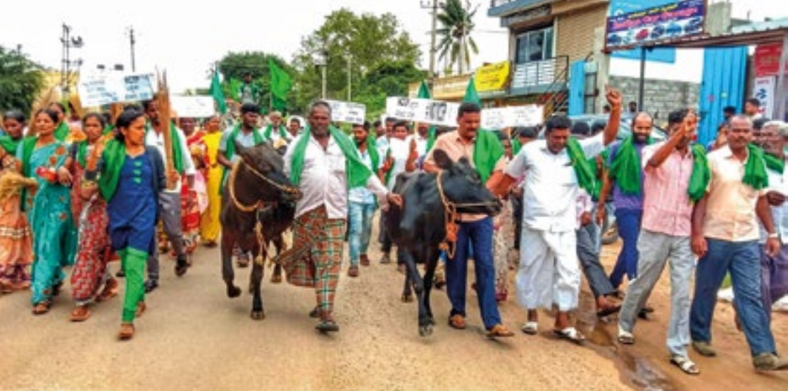
Productores de lácteos en India marchan en protesta contra la Asociación Económica Integral Regional (o RCEP por sus siglas en inglés). A causa de la presión del campesinado y la sociedad civil, India se retiró de las negociaciones en noviembre de 2019.

importante de la industria de lácteos en estas negociaciones comerciales. Impulsamos el mensaje de los grupos en la prensa y en los medios promovimos un claro mensaje: en las negociaciones de la RCEP, dejen fuera la agricultura y a los lácteos.