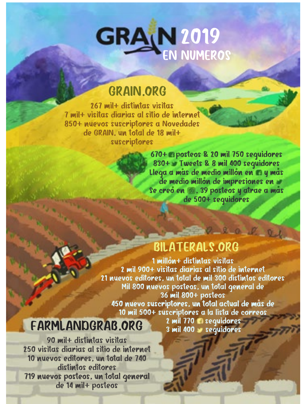
Ilustración de Megan Basaldua, www.basalmegvinegar.com

También sabemos que nuestro material es replicado más allá de nuestra capacidad de hacer seguimiento y cuantificarlo: los videos son vistos en grupos, el material es leído en radios comunitarias y los datos se comparten en presentaciones y en listas de correspondencia a suscriptores. Nuestro material en formato impreso también tiene un importante papel. Nuestro equipo comparte copias en las reuniones estratégicas, la infografía se imprime y se entrega como volantes en manifestaciones y las revistas circulan en los talleres, en todo el mundo. Aquí es donde nuestro material realmente llega a las bases, ayudando a dar forma a las estrategias, proporciona información para campañas y para sustentar argumentos.