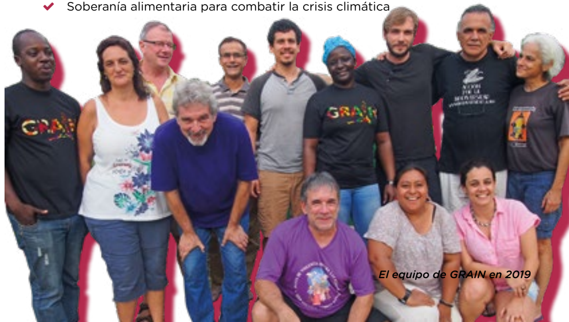
El equipo de GRAIN en 2019