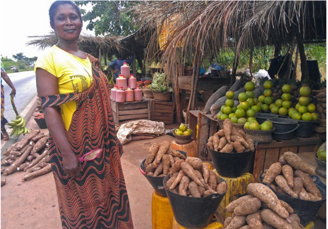
Une paysanne-vendeuse dans un petit marché de produits locaux près de la ville de Kumasi dans le Nord-Ouest d'Accra, la capitale du Ghana.

C'est la vérité dérangeante qui est toujours passée sous silence dans les débats gouvernementaux et les processus politiques de haut niveau. Dans le rapport de cette année du groupe de travail de la Commission européenne sur l'Afrique rurale, par exemple, de nombreuses discussions ont eu lieu sur la manière d'aider les agriculteurs africains à s'adapter au changement climatique, mais aucune mention n'est faite de la façon dont les exportations et les émissions de gaz à effet de serre du système alimentaire européen nuisent à la production alimentaire de l'Afrique et à sa capacité à faire face à la crise climatique (voir encadré : Le cas des produits laitiers). 46 Il est politiquement plus facile de dire aux petits agriculteurs africains ce qu'il faut faire (« pas d'agriculture itinérante », « utilisez des semences génétiquement modifiées intelligentes face au climat ») plutôt que de lutter contre les émissions massivement