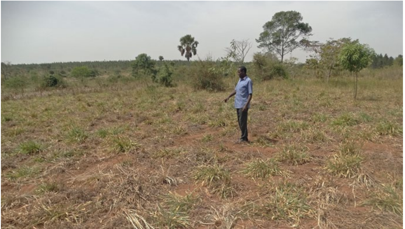
De l'herbe de fourrage brûlée à cause d'une sécheresse persistante dans le district de Nakasongola, au centre de l'Ouganda.

“L'on peut arriver à l'autosuffisance alimentaire grâce au soutien des gouvernements à la production locale, et non pas grâce aux entreprises agro-industrielles et au commerce international.”