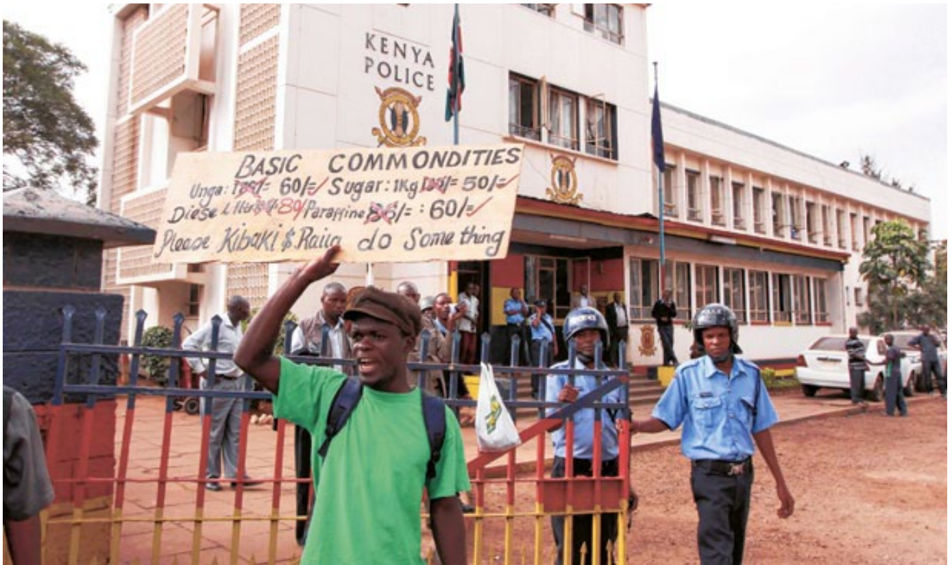
Une manifestation à Nairobi, au Kenya, pour protester contre la hausse des prix des denrées alimentaires. Déroulée en juillet 2011, la manifestation était organisée par la Unga Revolution (Révolution de la farine de maïs).

Mais, malgré les dénominations ronflantes de ces différentes initiatives, la plupart n'ont pas été à la hauteur de leurs ambitions. La production a progressé, mais les importations de céréales et d'autres produits alimentaires de base continuent d'augmenter dans de nombreux pays africains. Le problème tient en partie au fait que ces initiatives n'ont pas été accompagnées de suffisamment de mesures pour protéger la production locale du dumping des importations bon marché. La plupart des mesures étaient soit temporaires, ouvrant la porte aux abus des gros négociants et des contrebandiers, ou simplement trop faibles et bénéficiant de moyens trop insuffisants pour faire la différence. En outre, de nombreux gouvernements africains ont signé et/ou négocié des accords commerciaux qui rendent beaucoup plus difficile l'application de restrictions et de protections contre l'importation de denrées alimentaires pour les producteurs de produits alimentaires locaux, notamment la Zone de libre-échange continentale africaine (ZLEC) récemment signée. 15