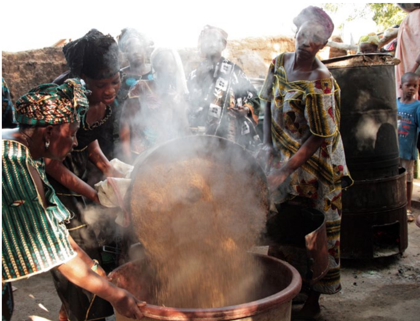
Transformation du riz local dans une coopérative de femmes à Dioro, au Mali.