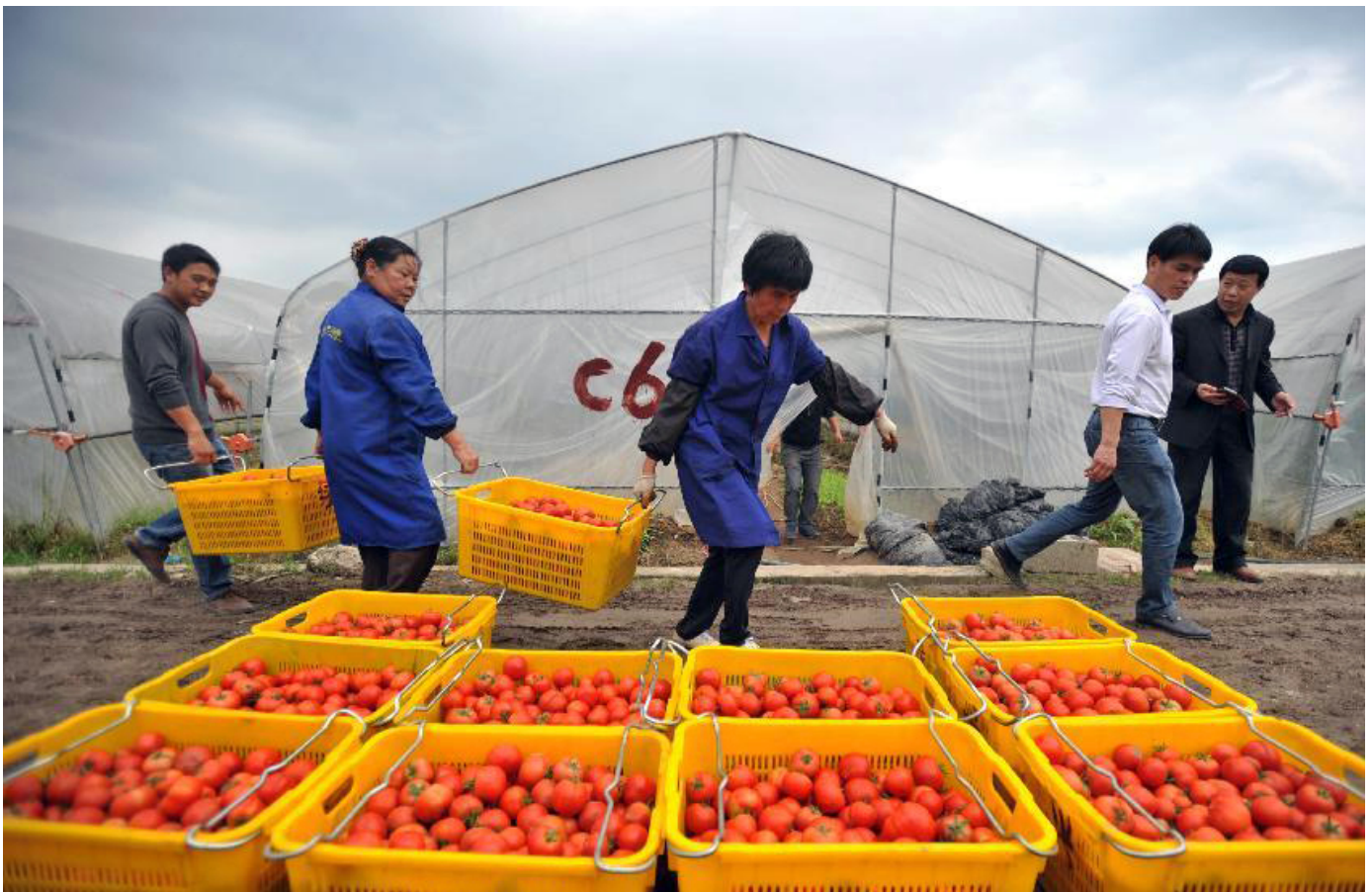
Des agriculteurs mettent des tomates en caisse dans le village de Guandao, en Chine du sud-ouest, pendant la récolte de printemps de 2014.