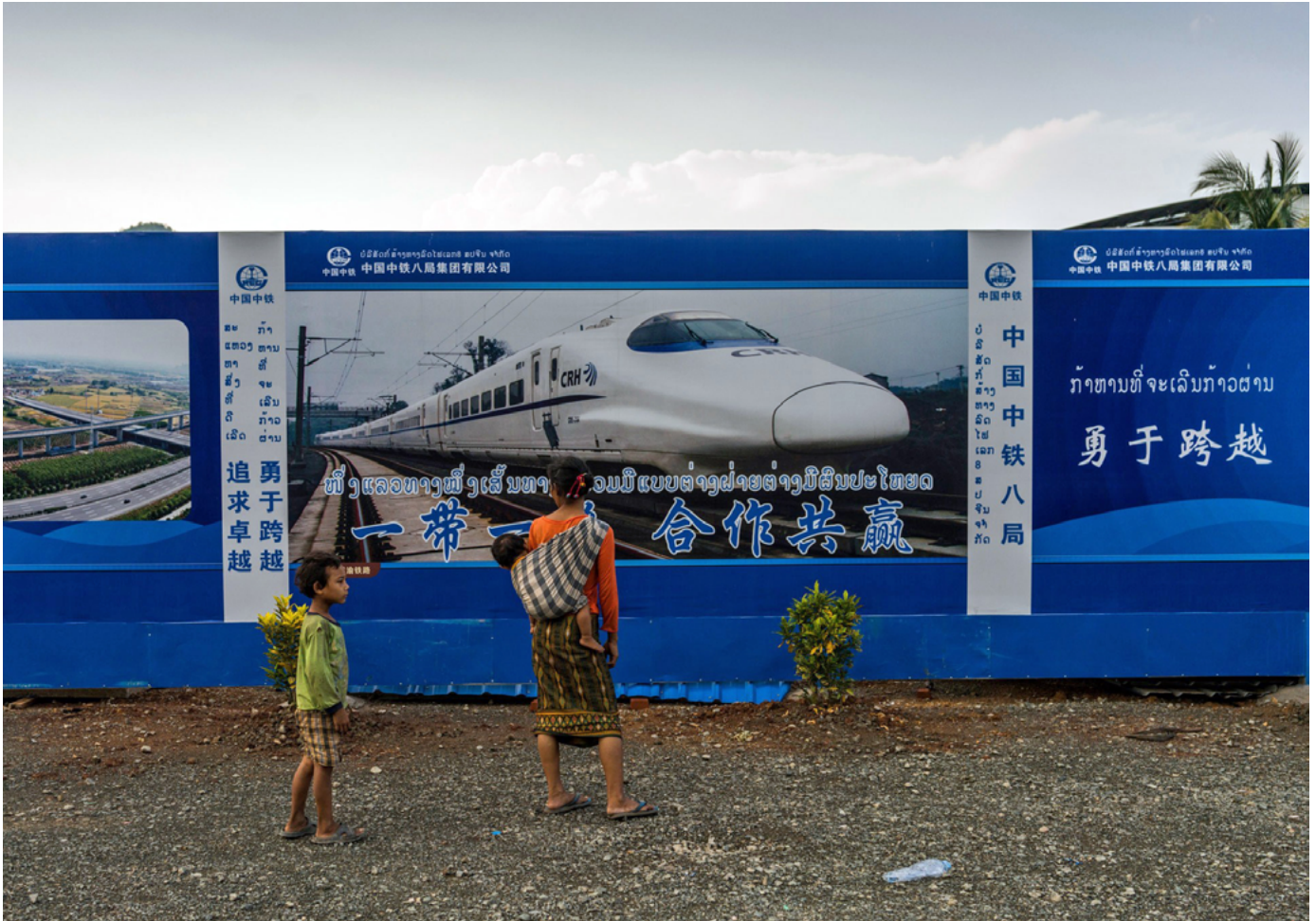
Affiche montrant un train à grande vitesse chinois, sur le chantier de construction d'un pont sur le Mékong, près de Luang Prabang, au Laos.

aux étrangers. À la suite des protestations, le gouvernement a repoussé la mise en place de cette mesure à décembre 2021. Toutefois, les protestations contre les grands investissements chinois continuent à faire rage, en particulier à propos des problèmes relatifs au travail.