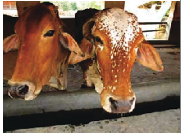
तस्वीर केसी नेगी....भारतीय उपमहाद्वीप की देशी प्रजाति सबसे ज्यादा उत्पादक है।

श्रीलंका की बॉस इंडिकस गाय कम से कम 5 बॉटल दूध (1 बोटल में 750 एमएल) या इससे भी ज्यादा दूध देती है। जानवर विभिन्न तरह के घास और चारे पर फलफूल सकते हैं। किसी भी प्रकार के विशिष्ट खानपान की आवश्यकता नहीं है। इस लिहाज से यह दूध उत्पादन का सस्ता और सुलभ जरिया है जो कि क्रीम और प्रोटीन से भरपूर है। भैंस की संख्या चाहे भारतीय हो या स्थानीय दोनों तरह के भैंसों को बढ़ाये जाने की जरूरत है। श्रीलंकाई बॉस इंडिकस प्रजाति को समेकित कृषि विकास खेत जोतने और ग्रामीण यातायात के लिए इस्तेमाल किया जाना चाहिए। गाय का गोबर और मूत्र मिट्टी को उपजाऊ बनाने, और उसके संरक्षण का बहुत ही बेहतर जरिया है। भारतीय किसान इसे जीवा अमृत-धन का स्रोत पुकारते हैं- और किसी भी राष्ट्र की शक्ति उसकी उपजाऊ मिट्टी, स्वस्थ पौधों और स्वस्थ मानव पर निर्भर करता है।