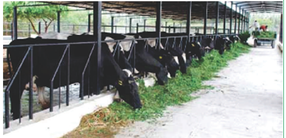
निजी डेयरी कंपनियाँ उच्च एकीकृत आपूर्ति शृंखला स्थापित करती है, ये अपना खुद का विशालकाय फार्म स्थापित कर इसकी शुरुआत करती हैं

निजी दुग्ध कंपनियों के बीच जो प्रचलित ट्रेंड दिख रहा है उससे साफ है कि वे साफ तौर पर समेकित रूप से दुध आपूर्ति चेन बनाने की दिशा में बढ़ रही हैं जिसके तहत वे बड़े-बड़े फार्म की शुरुआत करती दिख रही हैं। दुनिया की सबसे बड़ी दुग्ध उत्पादन कंपनी फौनटेरा का इंडियन फार्मर फर्नीचर को ऑपरेटिव इफको और भारतीय वित्तीय कंपनी ग्लोबल डेयरी हेल्थ जीडीएच के साथ एक संयुक्त उद्यम हैं जिसके तहत आंध्र प्रदेश के नजदीक नेल्लोर में इफको स्पेशल इकोनॉमिक जोन में 65 हेक्टेयर भूमि में 13,000 गायों के लिए डेयरी फार्म स्थापित किया