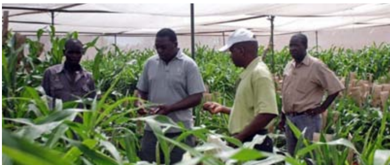
Essai de recherche au Nigeria

Na África, as OPDAg promovem os Planos de Investimento Nacionais através dos quais os países implementam O Programa Compreensivo de Desenvolvimento Agrícola Africano (PCDAA, adotado em Maputo, em 2003). Em julho de 2014, três países foram aprovados para receberem assistência do Banco Mundial através de OPDAg: o Gana, Moçambique e a Nigéria.