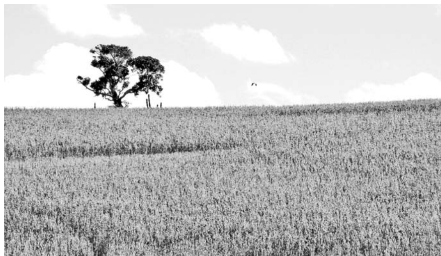
Soja en Rio Grande do Sul, Brasil.

los problemas en que se ocultan las causas profundas de los mismos para analizarlos o mostrarlos, muchas veces de manera sensacionalista, pero siempre aislados y producidos casi como “fenómenos naturales”.