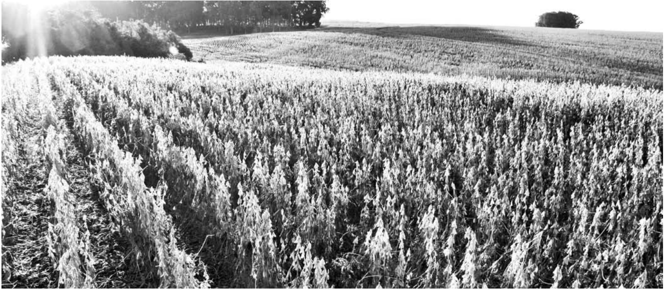
Soja en Rio Grande do Sul, Brasil.

Luego de pasar más de una década negando el surgimiento de malezas resistentes, Monsanto a través de su vicepresidente admitió este hecho y propuso una solución: reemplazar a toda la soja resistente al glifosato por una nueva soja resistente a un nuevo herbicida: el dicamba —de hecho aún más tóxico que el glifosato