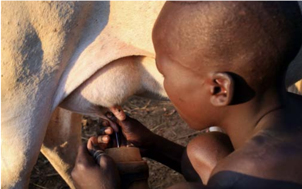
Jeune éleveur en train de traire une vache en Éthiopie. Les pastoralistes contribuent peu au changement climatique et leurs animaux ont de nombreux usages et avantages.

Il nous faut également chercher les causes profondes de la surconsommation de viande et de produits laitiers industriels bon marché. Ce qui veut dire s'attaquer aux énormes subventions qui sont derrière cette industrie. En 2013, les pays de l'OCDE ont distribué 53 milliards de dollars aux éleveurs et l'UE a versé 731 millions de dollars à la seule industrie du bétail. 39 La même année, le ministre de l'Agriculture des États-Unis a versé plus de 500 millions de dollars à 62 producteurs (Tyson Foods a été le mieux servi) afin d'assurer que les cantines scolaires aient accès à la viande et aux produits laitiers ; les producteurs de fruits et légumes n'ont eu droit, par contre, qu'à une fraction de ces subsides. 40