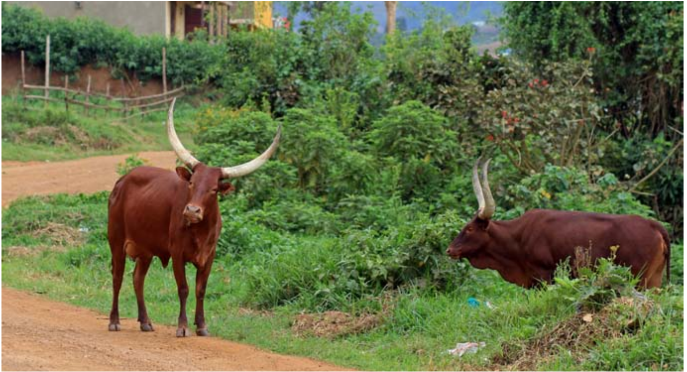
Vaches traditionnelles au bord d'une route au Rwanda. Dans le monde, deux cent mille petits éleveurs font paître leurs bêtes dans des zones souvent inadaptées à la culture.

tiers du total des émissions de méthane dû au fumier. 23