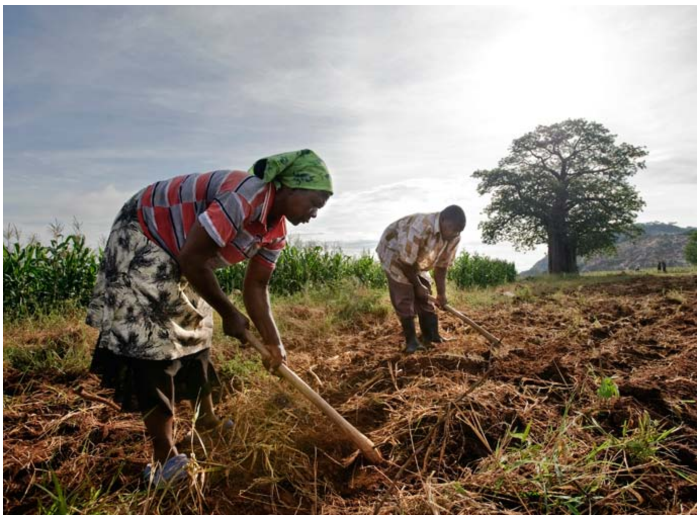
El acaparamiento global de tierras está lejos de terminar.