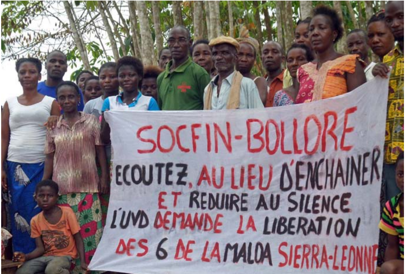
La expansión de los agronegocios es lo que ahora predomina. (Foto: Manifestación en una comunidad cerca de una plantación de Socfin en Costa de Marfil.

a incompetencia, arrogancia, inexperiencia o mala planificación, el colapso ayuda a explicar por qué el crecimiento en el número de negocios con tierras agrícolas desminuyó desde 2012 y por qué el número total de hectáreas también bajó.