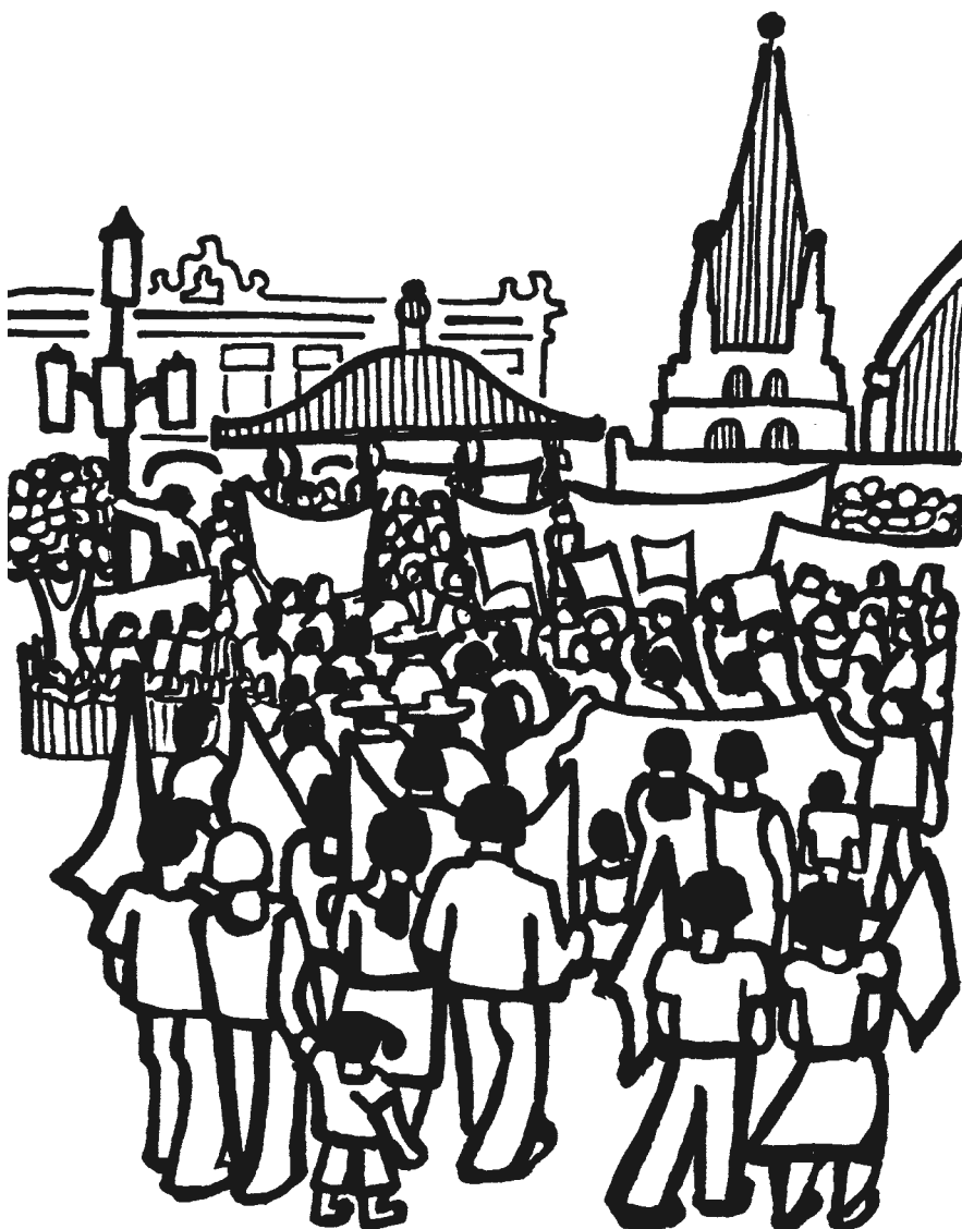
Ilustración: Rini Templeton

8. Entender nuestra verdadera soberanía. Esos espacios para pensar juntos también sirven para reafirmar entre todas las personas que conviven “hasta dónde nos quieren quitar lo que somos, hasta dónde nos quieren arrebatar nuestra soberanía, nuestra autodeterminación”, dice la gente.