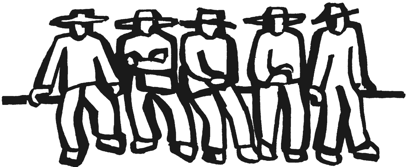
Ilustración: Rini Templeton

11. La tierra es invaluable. "Ser campesinos nos hace reverenciar, respetar y entender el profundo valor de la tierra. Ella nos cuida a todos. No es sólo una madre como dice la gente, es nuestra hermana, nuestra hijita, y por supuesto nuestra amante. Le pertenecemos, no la poseemos, y por supuesto, no tiene precio", dicen los sabios. "Fijarle precio a una tierra de cultivo es una agresión, no importa cuál sea el precio, sean siete, setenta, setecientos, siete mil, setenta mil o siete millones, billones o trillones de dólares, nunca podrán igualar lo que esta tierra puede