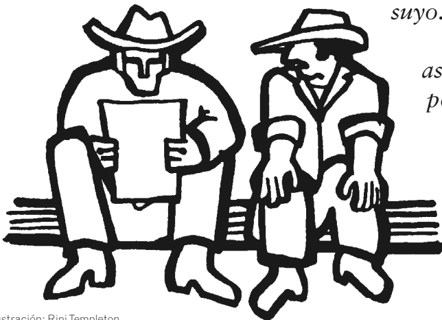
Ilustración: Rini Templeton

Los entrecomillados son frases que vuelven vez tras vez, por eso los presentamos como una sola voz que teje las siguientes reflexiones colectivas para fortalecer su autogobierno cotidiano: