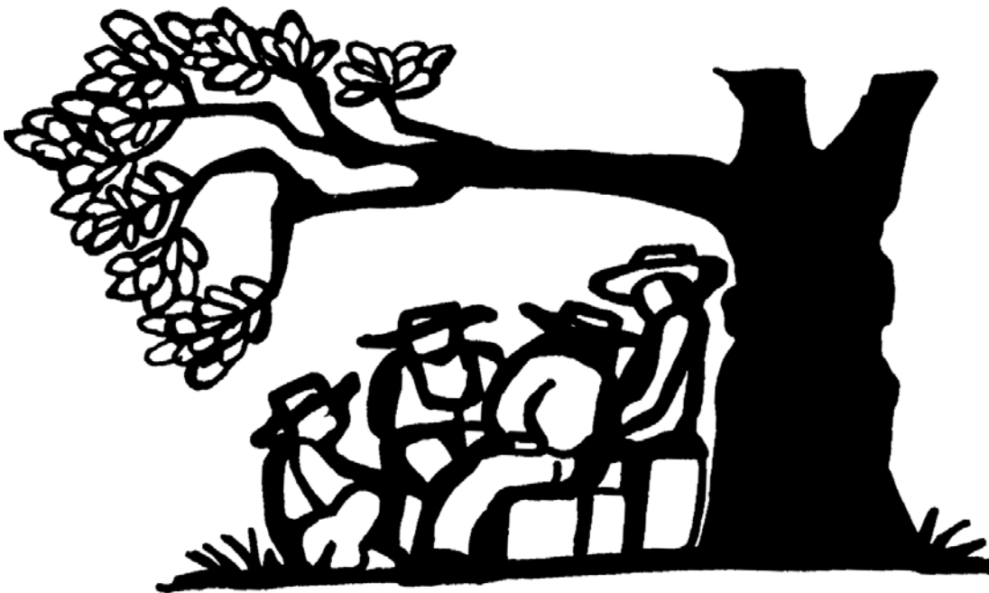
Ilustración: Rini Templeton

Así, además de apoderarse de vastas extensiones de terreno con todos sus recursos, pueden aprovechar la mano de obra de todos los expulsados.