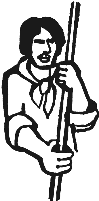
Ilustración: Rimi Templeton

das fuera, en quién sabe dónde. La gente se reconstituye como comunidad, como pueblo indígena, mestizo o afrodescendiente, como personas libres y organizadas.