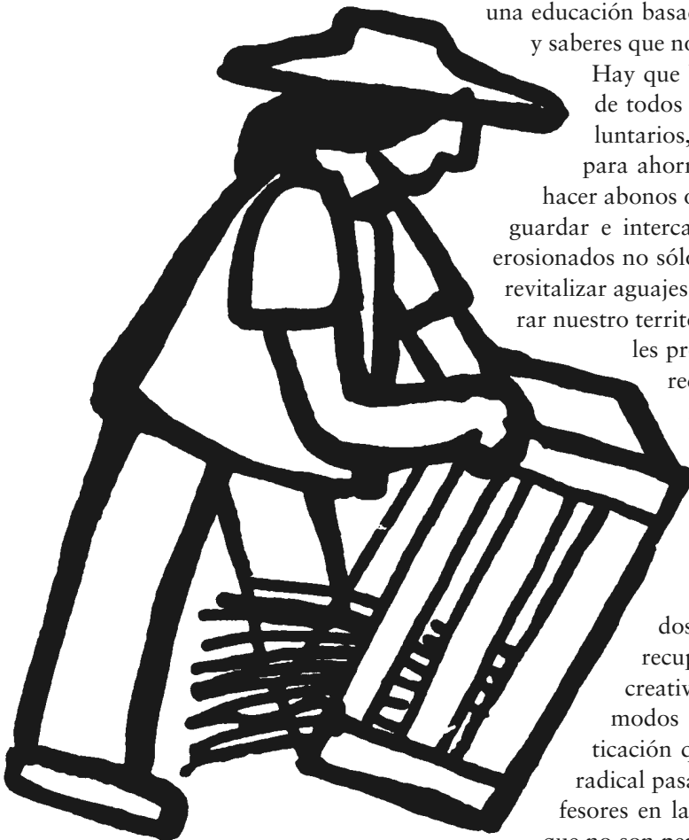
Ilustración: Rini Templeton