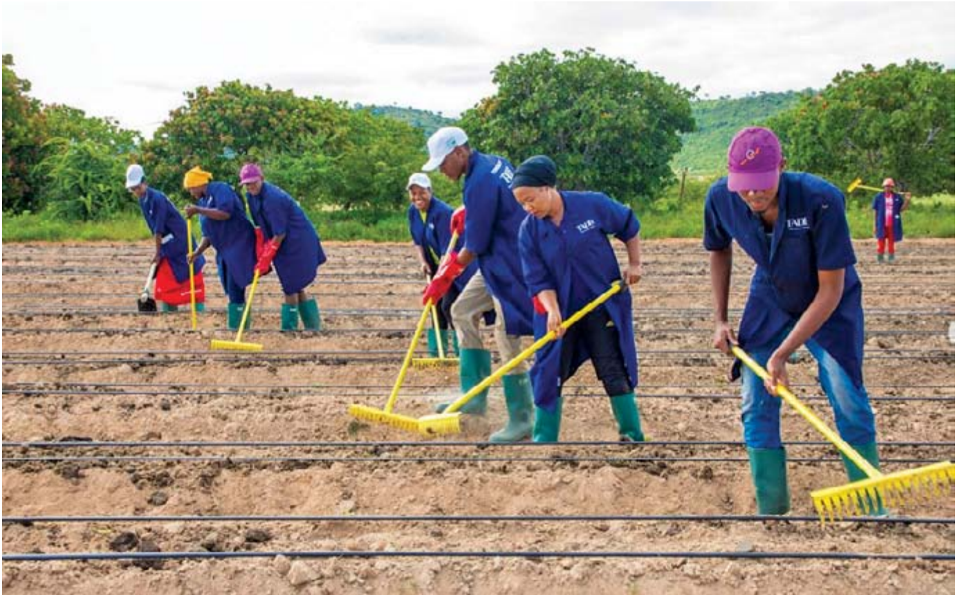
Picha ya pamoja ya wakulima vijana katika shamba, kitalu cha BBT Dodoma, Tanzania. Machi 25, 2023.

hizi - kuanzia Kilimo Kwanza (2006), kisha SAGCOT (2010), na hatimaye Mpango wa Matokeo Makubwa Sasa [Big Results Now] (2013) - zililenga kuhakikisha na kuwezesha maeneo makubwa ya ardhi yaweze kufikiwa na makampuni makubwa, chini ya imani na mtazamo kwamba Tanzania itakuwa kitovu na kinara wa uuzaji wa mazao nje ya nchi, itahakikisha usalama wa chakula na muhimu zaidi, italeti ajira, teknolojia, huduma mbali mbali (mafunzo, pembejeo, mashine, nk) pamoja na masoko mapya kwa wakulima wadogo wanaoishi karibu na mashamba. SAGCOT pekee ilidai ingeleta uwekezaji wa sekta binafsi wa dola bilioni 2.1. 4 Lakini baada ya miaka 10, sehemu ndogo sana ya uwekezaji ulioahidiwa ulikuwa umetokea, na, kati ya miradi michache iliyoanza utekelezaji, mingi kati yao ilishindwa, na imeacha urithi wa matatizo yanayopaswa kushughulikiwa kwa jamii zilizoathirika. 5