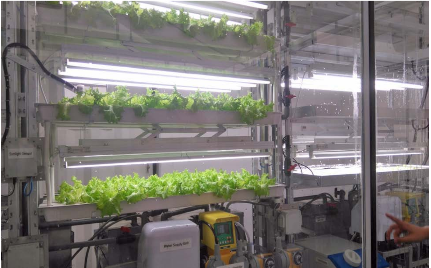
Ferme Fujitsu à Hanoi, Vietnam (2016).

monde, équivalente à 30 hectares. 1 Cela ne change guère la donne pour la production alimentaire mondiale.