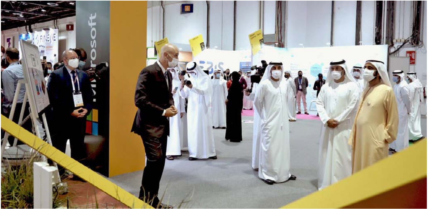
Le cheikh Mohammed bin Rashid, vice-président et premier ministre des Émirats arabes unis, et dirigeant de l'émirat de Dubaï, à GITEX2020, découvrant Azure FarmBeats.

initiatives dans le secteur alimentaire. Elles sont nouvelles dans l'agriculture, mais elles y investissent désormais massivement, en particulier dans les plateformes d'informations numériques connectées à leurs services cloud.