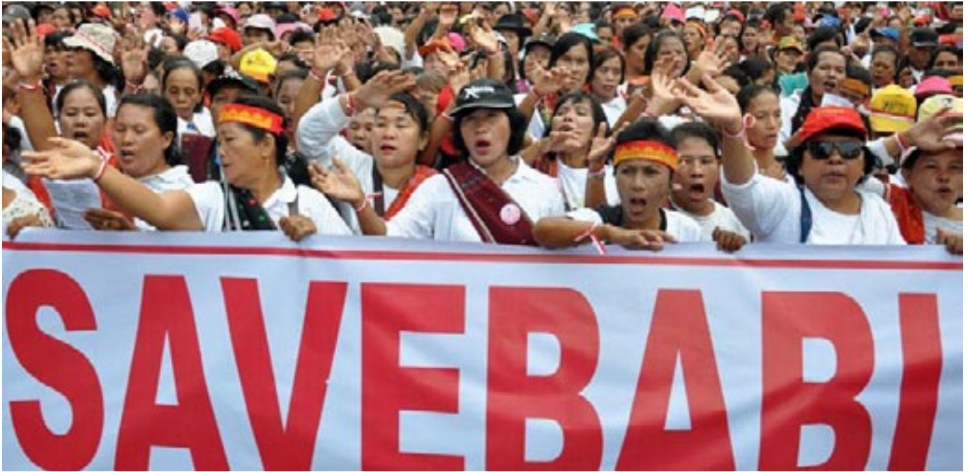
Personnes protestant contre un abattage massif de porcs prévu dans le nord de Sumatra, Indonésie, FÉV. 2020; Crédit: IndonesiaExpatBizz

sociétés d'élevage porcin, a ordonné l'abattage de tous les porcs détenus dans les petites exploitations dans un rayon de 20 km de chaque grande exploitation, alors même que les autorités étaient déjà complètement dépassées en essayant d'éliminer les cadavres de porcs dans les grandes porcheries. 45