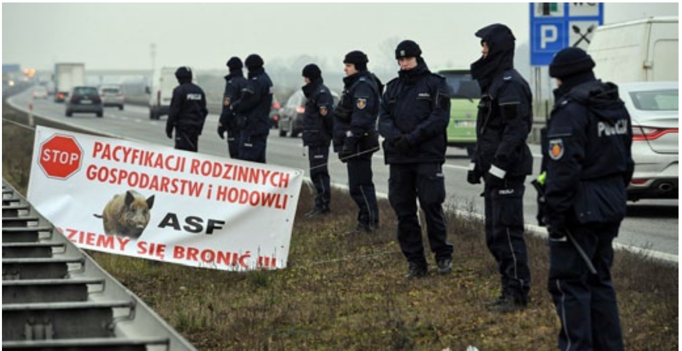
Des agriculteurs polonais bloquent l'autoroute A2 pour protester contre les mesures de leur gouvernement contre la PPA, DÉC. 2018

puis ils laissent l'agriculteur s'occuper des cadavres d'animaux.» 52