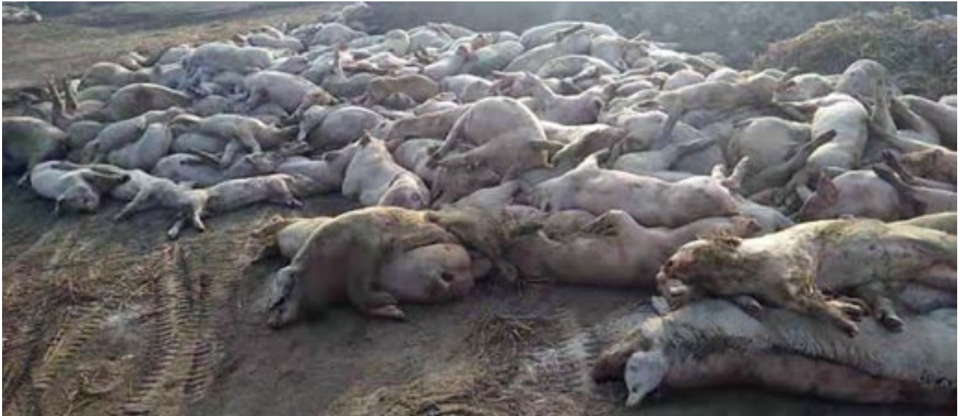
Cadavres de porcs du producteur de porcs chinois Sun Dawu, SEPT. 2019

agroholding appartenant à un homme d'affaires de Saint-Petersbourg a perdu 45 000 porcs lorsque sa méga-porcherie a subi une épidémie de PPA en 2012. 20 Même l'exploitation industrielle ultramoderne de la société danoise Dan-Invest AS n'a pas fait le poids face à la maladie. En 2012, la société a connu une épidémie qui a tué plus de 15 000 porcs, puis une autre en 2016, qui en a tué 31 000. 21