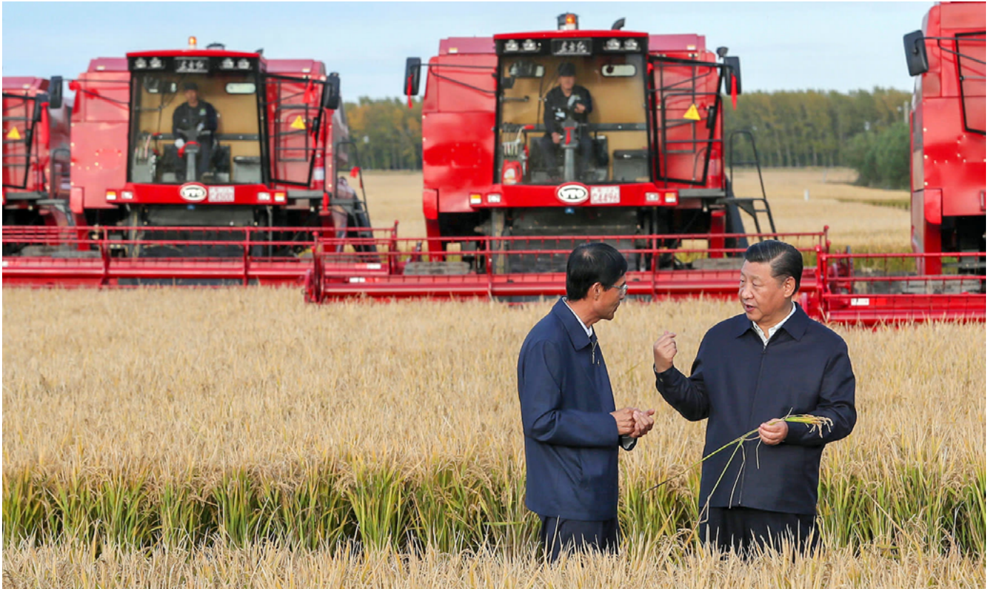
El presidente chino Xi Jinping visita la provincia de Heilongjiang, China, en septiembre de 2018.