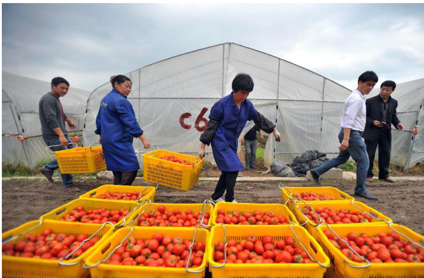
Agricultores empacando tomates en la aldea de Guandao, en el suroeste de China, durante la cosecha de primavera, 2014.

Las empresas chinas de agronegocios se globalizan